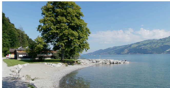
Regelfall Seeufer 15 m, Besitzstandsgarantie