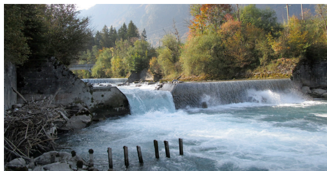
Sonderfall Kander, Richtplan gibt Gewässerraum vor

Die Festlegung der Gewässerräume in der baurechtlichen Grundordnung wird im Oktober / November 2022 zur Mitwirkung vorgelegt.