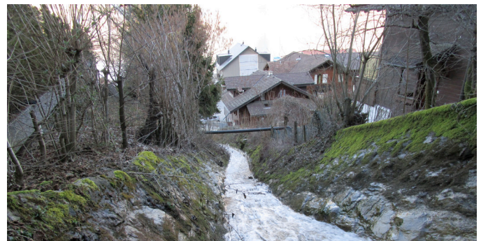
Bauzone: Priorität beim Hochwasserschutz

Die Lage der Gewässerräume wird im neuen Zonenplan 3 festgelegt und Nutzungsbeschränkungen im Baureglement festgeschrieben. Vielerorts ändert sich nichts, da die Übergangsbestimmungen des Bundes bereits für deutlich grössere Gewässerabstände gesorgt haben.