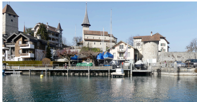
Ausnahme im dichten Siedlungsgebiet: 5 m