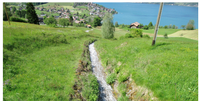
Landwirtschaftszone: Priorität bei Lebensraum und Artenvielfalt