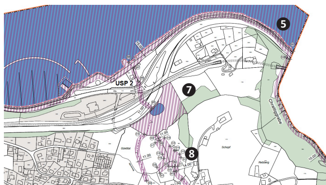
Ausschnitte Zonenplan 3 Faulensee